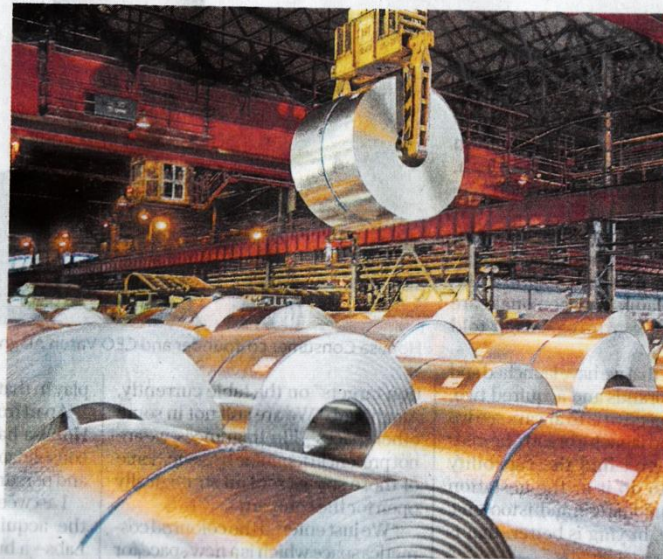
India recorded a surge in steel imports to 8.3 million tonnes in 2023-24, surpassing the country's exports of 7.5 million tonnes.

The delays in issuing BIS certification to Vietnamese companies come at a time when Indian manufacturers, especially steelmakers, have raised concerns of increasing imports from the South-East Asian country.