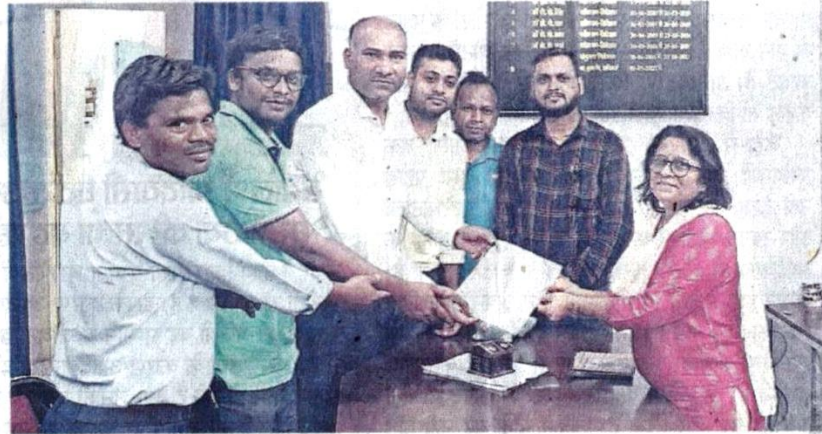
मांग पत्र सौंपते प्रतिनिधि मंडल।