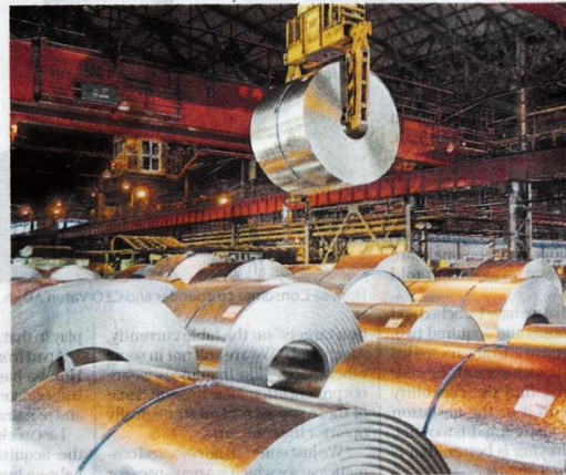
India recorded a surge in steel imports to 8.3 million tonnes in 2023-24, surpassing the country's exports of 7.5 million tonnes.

chiefly include manufacturers and traders of steel and footwear, and one company each in the polyester, tyres, chemicals, toys, batteries and MDF plywood sectors. While about half the applications are for renewal of certification, the