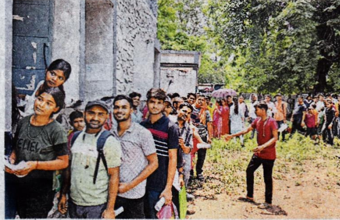
कल्याण विद्यालय परिसर में आवेदन जमा करने को लगी छात्र-छात्राओं की भीड़ • जागरण

आवेदन पत्र अभिभावक आवश्यक कागजात के साथ 31 मई तक जमा कर सकेंगे। इन विद्यालयों में काफी कम शुल्क में विद्यार्थियों को गुणवत्तायुक्त शिक्षा मिलेगी। इन विद्यालयों में बतौर शिक्षक भर्ती के लिए भी आवेदन निकला गया है। सीबीटी परीक्षा पास व्यक्ति शिक्षक व गैर शैक्षणिक पद पर आवेदन कर सकता है। फिलहाल नामांकन बीआईएसएसएस दो सी, बीआईएसएसएस आठ बी, बीआईएसएसएस नौ ई, बीआईएसएसएस तीन व 12 ई, बोकारो स्टील कल्याण विद्यालय सेक्टर तीन डी व बोकारो स्टील बालिका कल्याण विद्यालय नौ बी में कक्षा नर्सरी से कक्षा एक में 40-40 सीट पर विद्यार्थियों का नामांकन होगा।